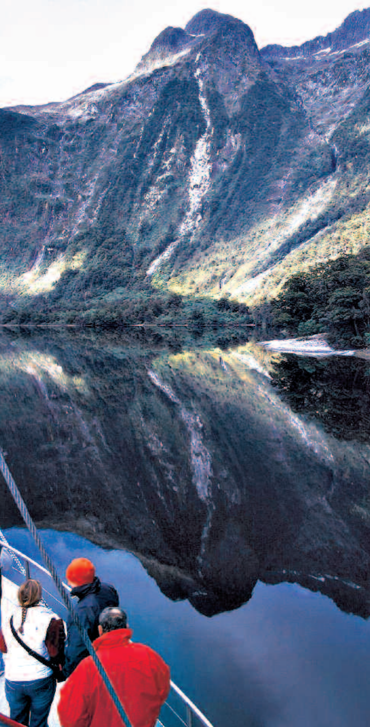
Når vandet er stille i Doubtful Sound fremkommer de mest fantastiske spejrefleksioner.

► surrealistiske. Takket være et årligt regnfald på næsten otte meter, stortrives den tempererede regnskov, og der går stort set ikke en dag uden regn.