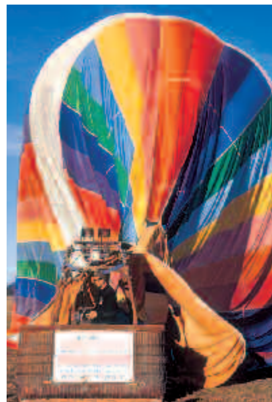
Mount Hutt byder på meget andet end bare vilde ture på ski. Også en ballontur højt til himmels kan anbefales. Desuden er der masser af adventure sport, der kan friste de vovemodige.

»I år er tilsyneladende en af de bedste sæsoner, de har haft. Sneen er fantastisk og dybden imponerende. Jeg har mødt flere, som efter et besøg her er rejst videre til løjperne i Wanaka og Queenstown, men som så er kommet tilbage til Mount Hutt, fordi sneen er bedre. Niveauet er fedt, der er noget for alle – især begyndere og intermediate, hvilket er skønt, når man er en familie. Og for en